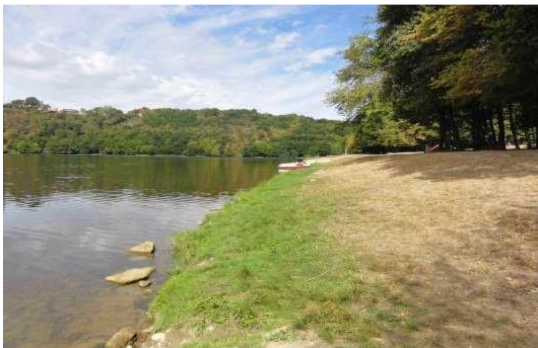
SECTEUR BOURG D'HEM (12 à 15 places)