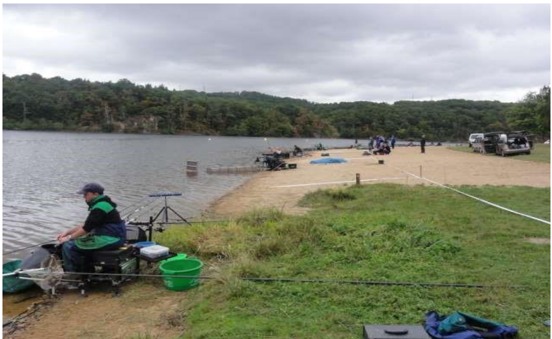
ANZEME SECTEUR PLAGE (12 à 15 places)