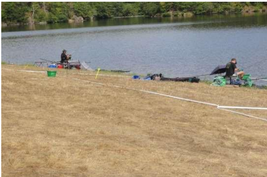
ANZEME SECTEUR PRE/BOIS (12 à 15 places)